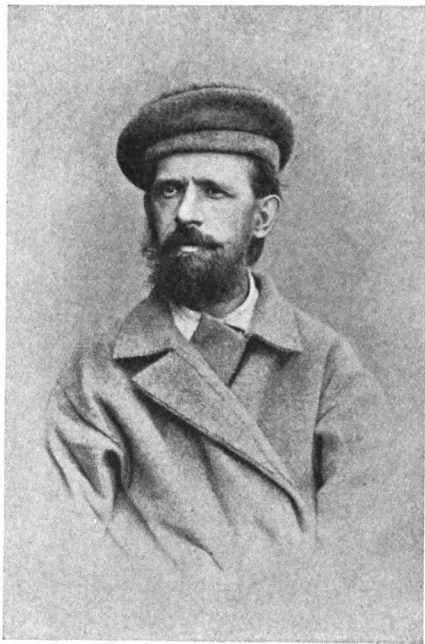
Ипполитъ Никитичъ МЫШКИНЪ.