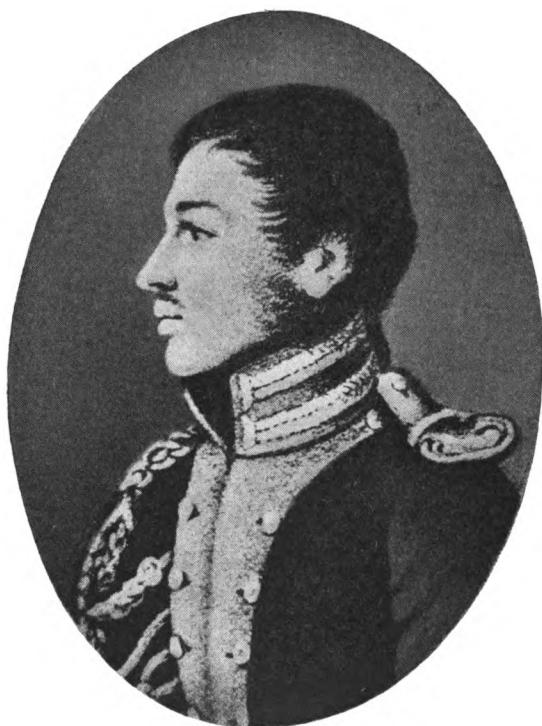
Павель Иванович ПЕСТЕЛЬ.