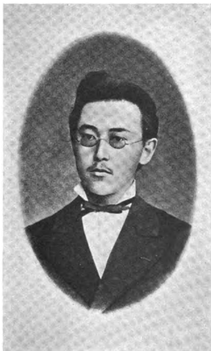
Константи́нъ Гавриловичъ НЕУСТРОЕВЪ.