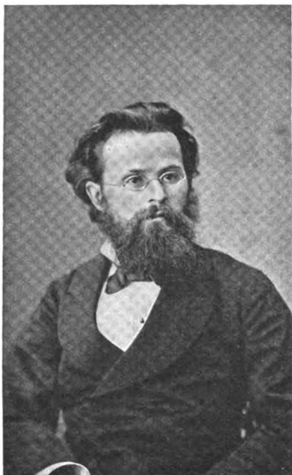
Николай Александрович МОРОЗОВЪ.