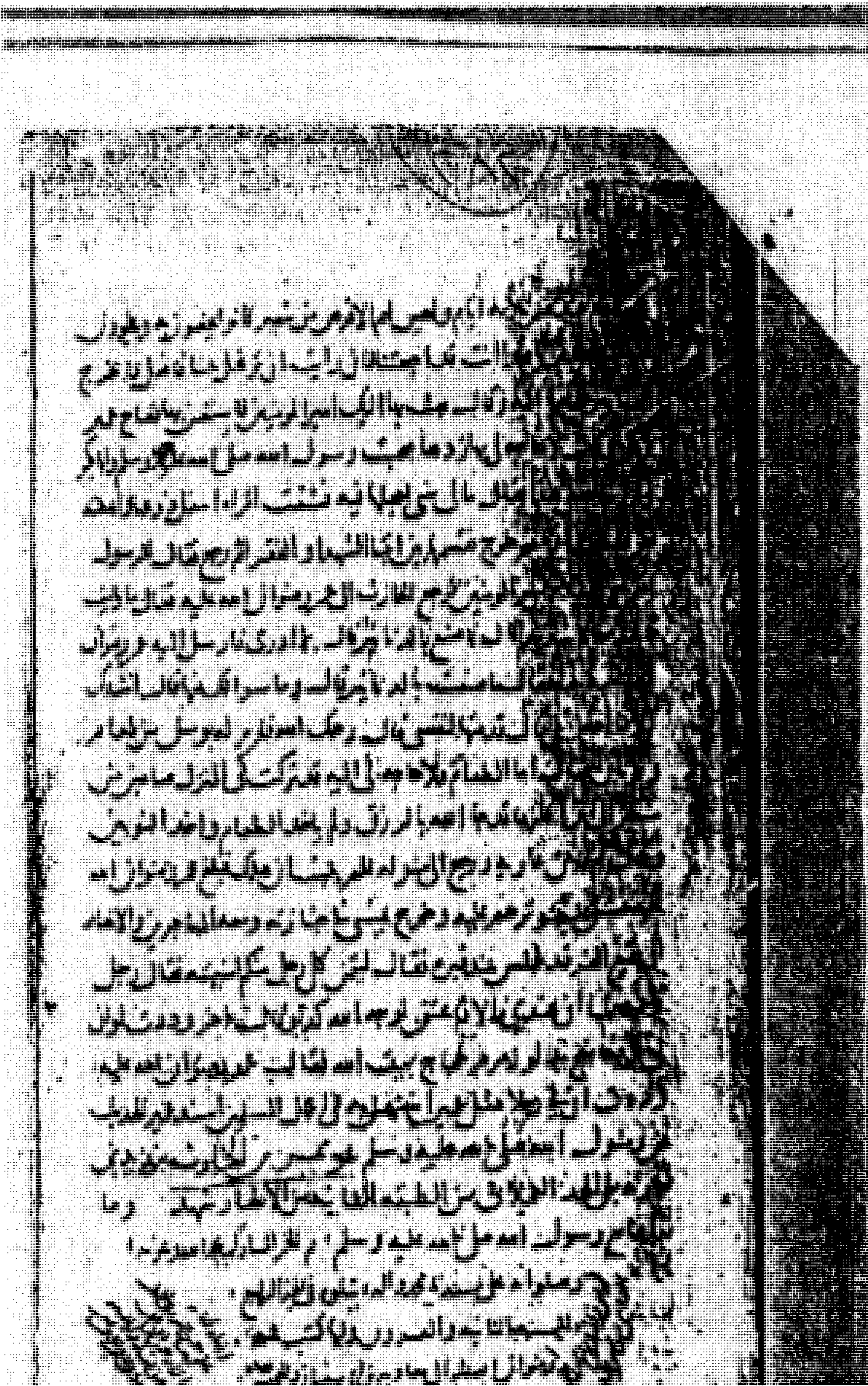
الصفحة الأخيرة من الجزء الثالث من نسخة أحمد الثالث