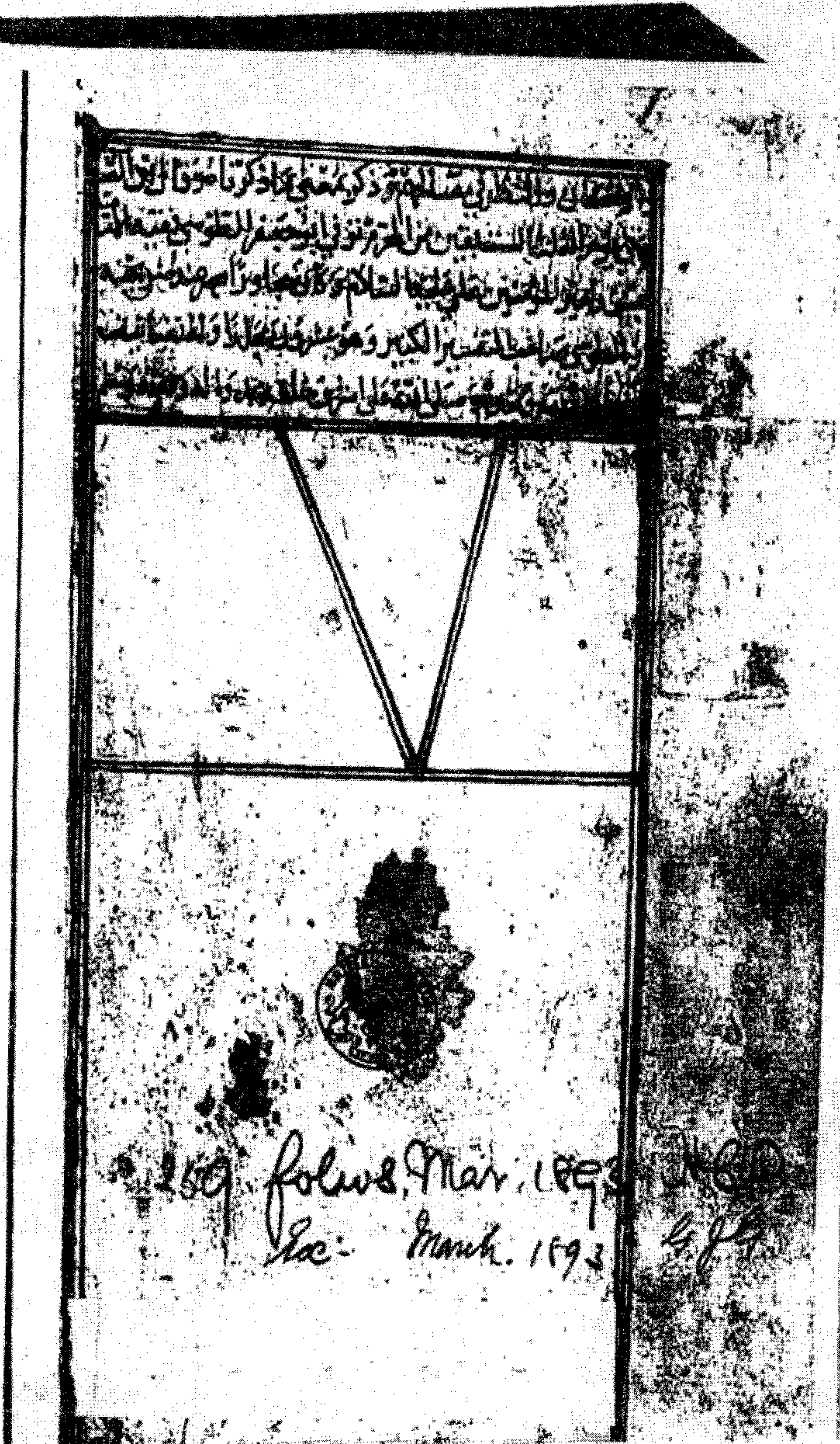
الصفحة الأخيرة من نسخة المتحف البريطاني